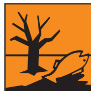
Perigoso para o ambiente

A embalagem vazia deverá ser lavada três vezes, fechada, inutilizada e colocada em sacos de recolha, devendo estes serem entregues num centro de recepção autorizado; as águas de lavagem deverão ser usadas na preparação da calda.