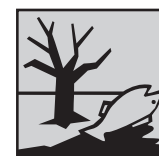
PERIGOSO PARA O AMBIENTE