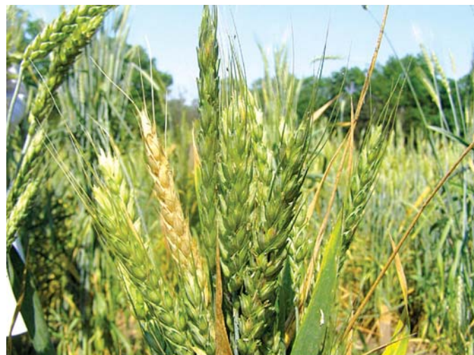
Фузаріоз колосу пшениці – для захисту застосовувався контрафактний Альто Супер. Результат – відсутність фунгіцидного ефекту + опік колоскових лусок.

Фальсифіковані пестициди у більшості випадків потрапляють в Україну з-за кордону під виглядом інших товарів. Вони, як правило, вже відповідним чином розфасовані, однак можуть фасуватися і в Україні (що особливо стосується препаратів, які застосовуються на присадібних ділянках). Якість та ефективність підробок буває різною. Як правило, це дешевелений замінник оригінального препарату з тою ж або подібною діючою речовиною. Однак застосування таких препаратів може шкодити культурним рослинам внаслідок агресивних хімічних домішок, які наявні в їх складі. В значно рідших випадках підробка може бути речовиною, основним