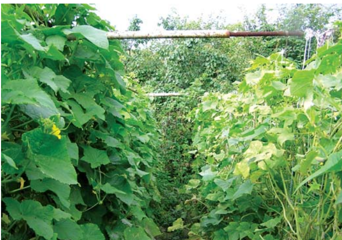
Конфідор оригінальний (ліворуч) і контрафактний (праворуч)