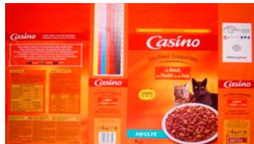
Projekt Nr. 2: Mehrschichtfolie – Fines croquettes au boeuf et au poulet 4 Kg