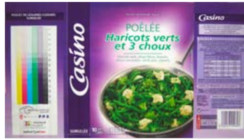
Projekt Nr. 1: Einschichtfolie – Poêlée Haricots verts et 3 choux

Die Médialliance-Gruppe hat unlängst beschlossen, die Cyrel® FAST-Technologie bei sich einzuführen und arbeitet bereits an zahlreichen Projekten mit anderen Auftraggebern.