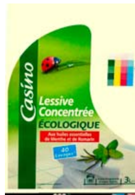
Projekt Nr. 3: Etiketten – Lessive concentrée écologique 3 L