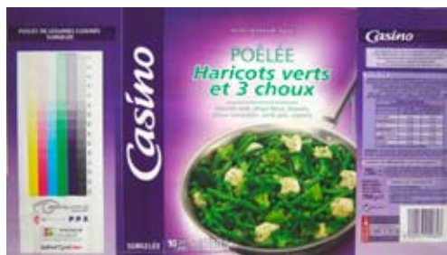
Proyecto nº. 1: Película monocapa - Poêlée Haricots verts et 3 choux