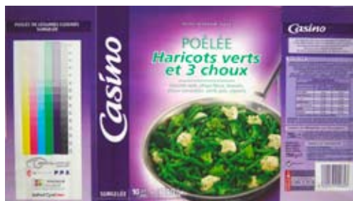
Progetto n. 1: Pellicola monostrato - Poêlée Haricots verts et 3 choux

Il processo di sviluppo termico delle lastre fotopolimeriche Cyrel® FAST di DuPont Nemours soddisfa il bisogno di ridurre