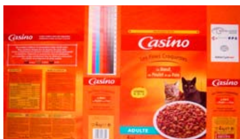
Progetto n. 2: Pellicola multistrato - Fines croquettes au boeuf et au poulet 4 Kg