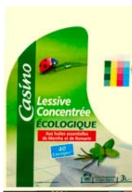
Progetto n. 3: Etichette - Lessive concentrée écologique 3 L.