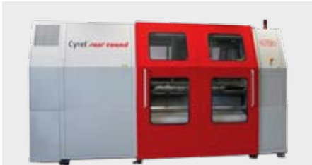
DuPont™ Cyrel® FAST round FR 1450