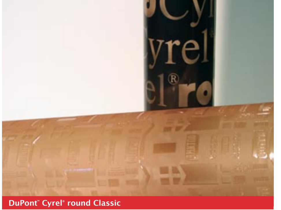
DuPont™ Cyrel® round Classic