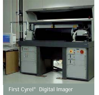
First Cyrel® Digital Imager

Lisa DiGate'in de belirttiği üzere bunlar ambalajlı tüketim malları üreticilerinin ve toptancıların ilgi çekici grafikler, raftan alım hızı ve maliyet verimliliği gibi konularda ihtiyaçlarını karşılayabilmeleri açısından fl eksografi cilere yardımcı olmaktadır.