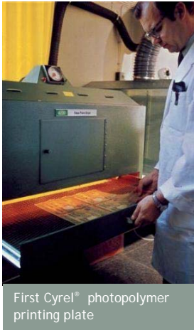
First Cyrel® photopolymer printing plate

DuPont Ambalaj Grafikleri 600 patent ve uluslararası uygulamayı kapsayan 125 patent grubunun tescilinin tamamlandığını duyurdu. DuPont Ambalaj Grafikleri iş biriminin sunduğu teknolojik yenilikleri gösteren bu patentler, müşterilere verimliliklerini, ürün ve servislerinin kalitesini artırma fırsatı sunan çeşitli ürün, ekipman ve prosesleri kapsamaktadır.