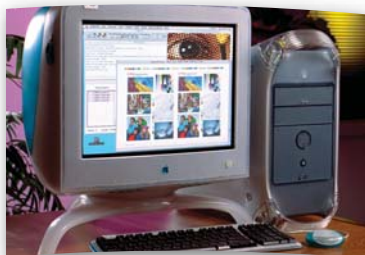
Estación de diseño