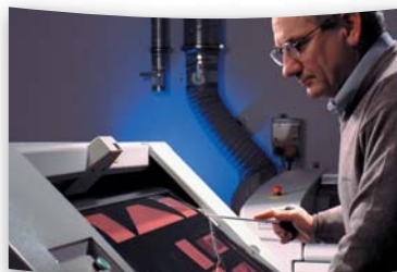
DuPont® Cyrel® Digital