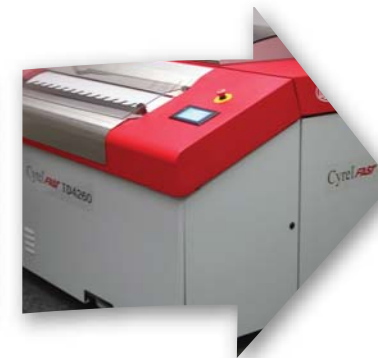
Procesador Cyrel® FAST